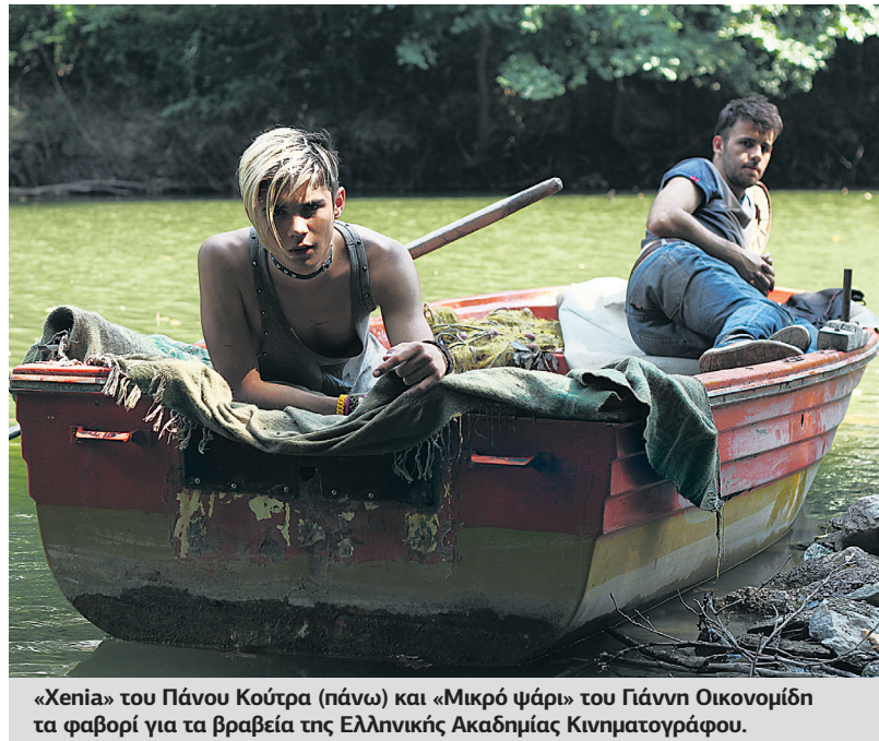
«Xenia» του Πάνου Κούτρα (πάνω) και «Μικρό ψάρι» του Γιάννη Οικονομίδη τα φαβορί για τα βραβεία της Ελληνικής Ακαδημίας Κινηματογράφου.

15 ΥΠΟΨΗΦΙΟΤΗΤΕΣ ΓΙΑ ΤΗΝ «XENIA», ΑΚΟΛΟΥΘΕΙ ΤΟ «ΜΙΚΡΟ ΨΑΡΙ»