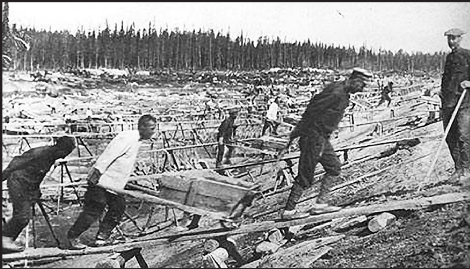
Καταναγκαστικά έργα στη Σιβηρία. Χιλιάδες πολίτες πέρασαν από τα γκούλαγκ του Στάλιν.

Όπως ο Αλεξάντερ Μαλτσένκο, φίλος του Λένιν από τα πρώτα νεανικά χρόνια. Ή ο Μιχαήλ Φρινόφσκι, υποδιοικητής της μυστικής αστυνομίας. Μαζί μ' αυτόν εκτελέστηκε και όλη η οικογένειά του. Ή ο Νικολάι Γέζοφ, δεξί χέρι του Στάλιν, ο άνθρωπος που ανέλαβε να καθάρσει τον τροτσκισμό και που το 1936, μόνο, διέταξε τη δολοφονία 3.000 αξιωματικών. Απ' αυτόν δεν έμεινε ούτε η φωτογραφία του. Υπάρχουν ακόμη μέλη του Κομμουνιστικού